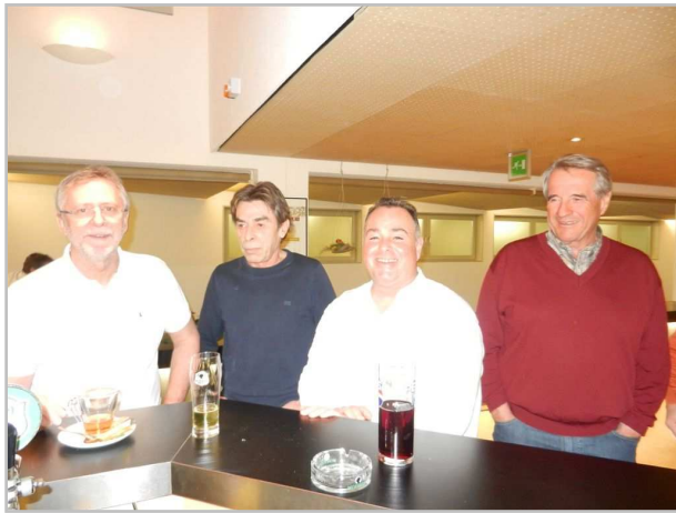
Alle freuen sich schon auf's Kegeln