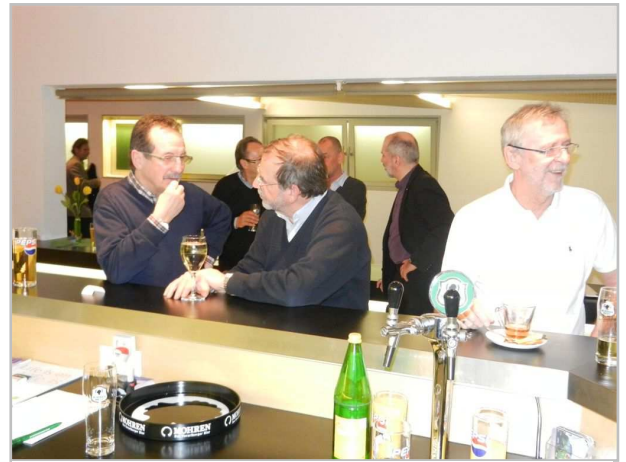
Gute Gespräche gehörten auch dazu