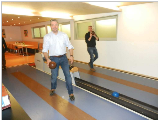
..ob die „Jungen“, oder die etwas älteren