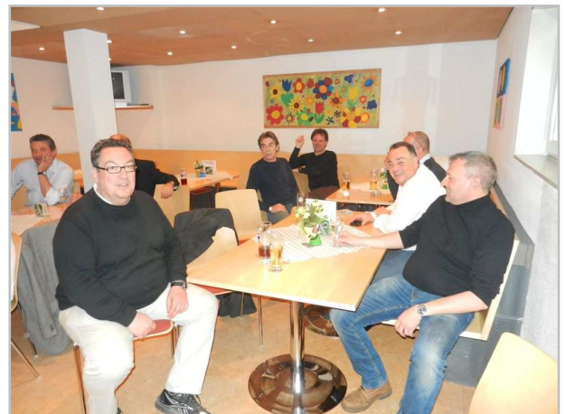
..es machte sichtlich Spaß