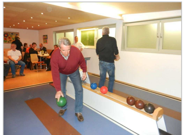
..jeder war voll Begeisterung dabei!