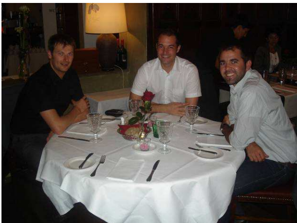
Auch eine Abordnung der Round-Tables ließen sich die Gelegenheit nicht entgehen