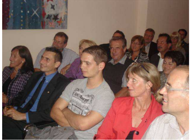
Trotz einiger kurzfristiger Krankmeldungen waren 37 interessierte Zuhörer der Einladung gefolgt