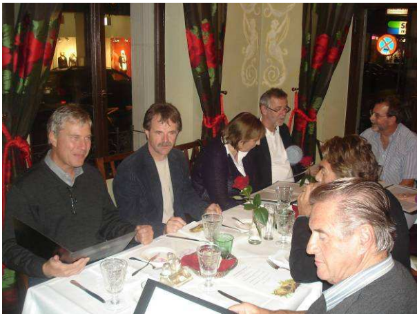
Die AC`ler ließen den gelungenen Abend gemütlich im Stadtgasthaus ausklingen