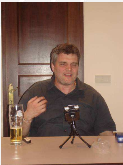
Bilder sagen mehr als 1000 Worte