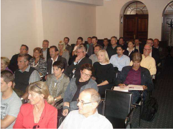
Der Seminarraum des Hotel Weissen Kreuz war voll besetzt