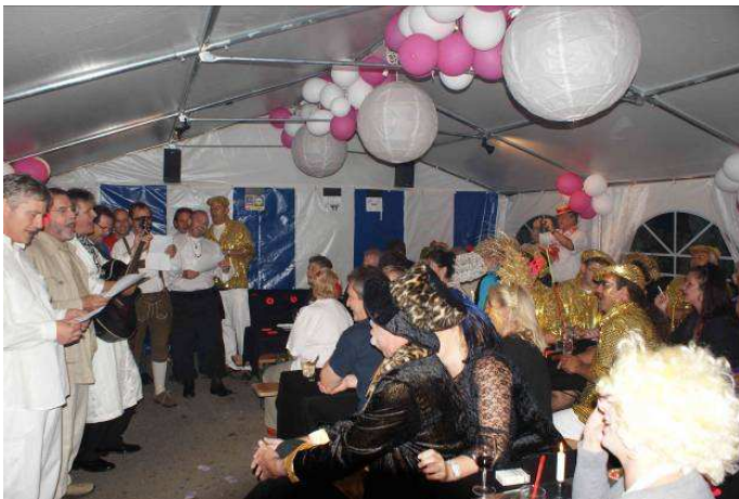
Der spontan gegründete AC- Bodensee-Chor unterhielt den Jubilar und seine Gäste