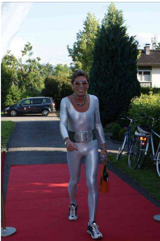
Mutige AC-Mitglieder zeigten Akaelles vom Life-Ball