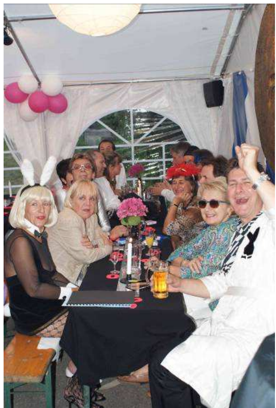
AC-Mitglieder in Partystimmung