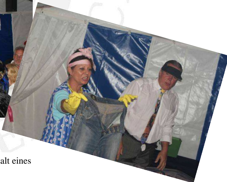
Fundbüro: „Was erzählt der Inhalt eines Koffers über den Besitzer?“